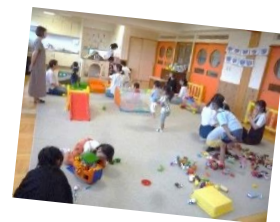
広々としたお部屋でたくさん遊ぼう♪

ご家庭の都合に合わせてお子さまを一時的にお預かりします。詳しい内容については電話にてお問い合わせ下さい。