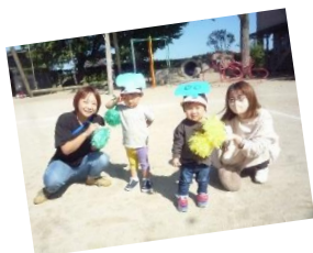
ミニ運動会ごっこ

いしまち認定こども園「地域子育て支援事業」は、子ども同士のふれあいやお母さん方との情報交換、職員への育児お話しができる場となっています。そして季節を感じる製作や親子クッキングなど、楽しい思い出に残る体験をしています。活動後は、おやつやお茶の時間があったり、お部屋の中で自由遊びをしたり、ホッと一息つける時を過ごします。皆様お誘い合わせのうえ、ぜひご参加下さい。みんなで一緒に楽しい時間を過ごしましょう！！